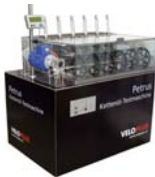
Petrus von Veloplus: Das weltweit erste Testlabor für Kettenöle simuliert Regengüsse und Sandpisten.

Regengüsse und trockene Passagen steuert der eingebaute Computer. Mit einer Last von je 50 - 100 Watt laufen so sechs Ketten parallel unter gleichen Bedingungen. Anhand der Kettenlänge lässt sich der Verschleiss ablesen, respektive die Qualität des Kettenöls. Diesmal dauert ein Test-Zyklus sechzehn Stunden, erst dann wird nachgeschmiert. Dies entspricht einer Distanz von ca. 690 Kilometern. Beim Wasser-test regnet es pro Stunde jeweils 15 Minuten. Dieses Programm läuft 64 Std. also 2750 Kilometer. Am härtesten ist der Sandpisten-