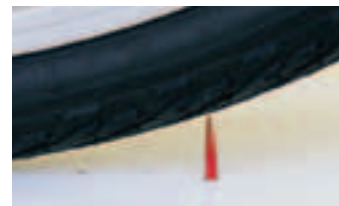
Mit Nägeln und Dornen simulieren wir die Widrigkeiten im Veloalltag.

schicht (z.B. Schwalbe Marathon Plus). Andererseits gibt es nachrüstbare Systeme wie Pannenschutz-einlagen (z.B. Flat-Away von Panaracer) und Dichtflüssigkeit für den Schlauch (z.B. von No-Tubes). Die Pannenschutz-einlage wird einfach in den bestehenden Reifen als einzige oder zusätzliche Schutzschicht eingelegt. Die Dichtflüssigkeit soll durch die