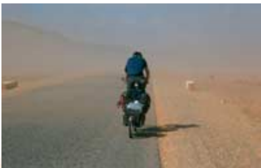
Ein kleiner Sandsturm in der Sahara