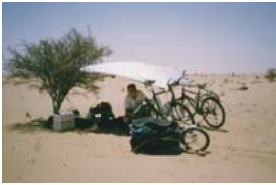
Warten auf den Abend unter dem improvisierten Sonnzelt mitten in der Sahara in Mauretanien