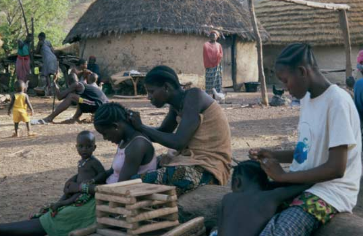
Bassari-Frauen im Senegal arbeiten an kunstvollen Frisuren