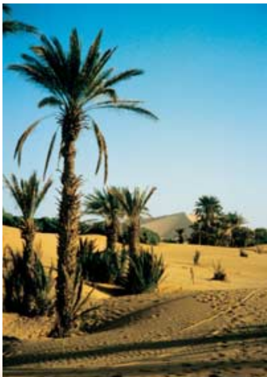
Dünenlandschaft in Marokko

Auf der Westafrika-Landkarte entdeckten wir die Verbindung durch die Sahara von Europa nach Westafrika, die gemäss unseren Berechnungen und den eingezeichneten Wasserstellen per Velo machbar sein müsste: Über Marokko der Küste entlang durch Mauretanien bis nach