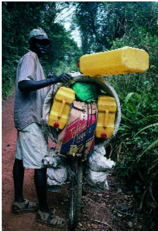
Die Kadahuilés fahren mit voller Ladung Hunderte von Kilometern.

Hunderte arbeitslose kongolische Radfahrer, sie nennen sich «Kadahuilé» von Kada wie Kadhafi und Huilé wie Öl, transportierten 110-Liter-Kanister mit Palmöl, Kerosin oder Zucker 500 bis 600 Kilometer von Uganda in den Kongo oder umgekehrt. Bergauf waren sie unsichtbar, marschierten wie eine nicht endende Ameisenkolonne hinter den hoch aufgetürmten Stapeln ihrer gelben Kanister. Mit Fahrradschläuchen waren die Lasten auf dem Gepäckträger ihres chinesischen «Flying Pigeon» oder indischen «Hero» festgezurr. Sie sind wahre Helden und mehr als einmal halfen sie Stephan mit dem Hammer und öligen schwarzen Händen sein Velo zu reparieren. Einmal gab ich ihnen von meiner Gummilösung, um einen Schlauch zu flicken, aber das hielt nicht. Die tropische Luft war viel zu feucht, um den Schlauch damit abzudichten. Ein Radfahrer der, wie alle anderen, seine Reifen mit Einkaufstüten geflickt hatte, zog ein Stück glühendes Holz aus dem Feuer, um den Flicker (ein Stück alter Schlauch) abzulösen und benutzte zusätzlich seine Machete um die Oberfläche zu säubern. Ein daneben stehender Pygmäe bot an, die