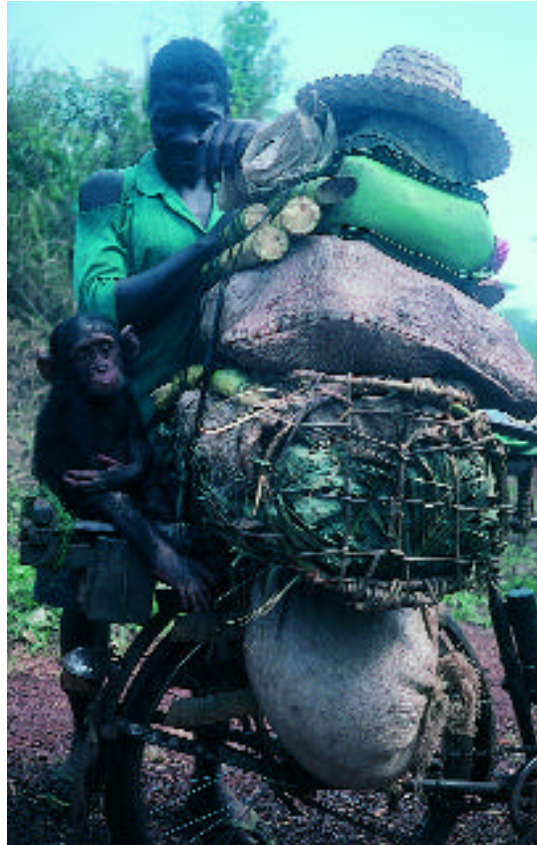
Kleine Schimpansen reisen als traurige Gefangene auf dem Gepäckträger

Nacht abzuwarten, um dann «curare», den «König der Gifte» zu besorgen. Das Gift bringt jedes Tier um, und es scheint auch der perfekte Klebstoff für Veloschläuche zu sein. Täglich fahren Hunderte von Kadahuilés auf den Strassen Kongos. Gutes Geschäft witternd, stellten die hier ansässigen Familien improvisierte Küchen am Strassenrand auf. Sie verkauften entlang des Weges Maniok-Bällchen und manchmal auch Reis. Wir hatten weder grosse Lust darauf, einen toten Affen zu essen, noch einen lebenden zu kaufen. Der Blick eines kleinen Schimpansen, der mit Seilen auf dem Gepäckträger eines Velos festgezurr war, durchbohrte uns mit einem fürchterlich leidenden und menschlichen Ausdruck.