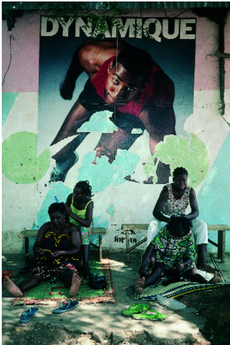
Der Alltag hat seine eigene Dynamik...

ten uns ein paar Velofahrer voller Gefühl die genaue Angriffsstelle, bei der Hunderte von Söldnern aus dem Tschad ihr Leben verloren hatten. Von denen, die gekommen waren, um Kabilas Truppen zu retten, waren nur die Knochen übrig geblieben.