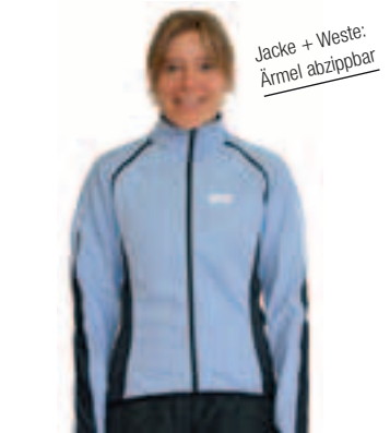
Jacke + Weste: Ärmel abzipptbar