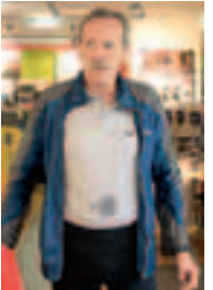
Die federleichte Kokon hält sich überraschend gut.