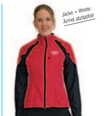
Jacke + Weste: Ärmel abzipptbar