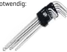
HEXER Kugelinbus-Set Art. 318.008