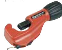
SPEEDCUTTER Rohrschneider Art. 318.685