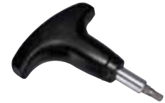
FIX Drehmomentschlüssel 5nm Art. 100.1555