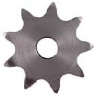
Vorher: Das neue, CNC gefräste Stahlritzel brems die Ketten mit 50 – 150 Watt.

Gemessen haben wir die Ketten über die ganze Länge vor und nach den Tests. Dank unserem Petrus-Labor können wir bei allen Ketten die genau gleichen, reproduzierbaren Bedingungen schaffen. Gibt ein Öl die Schmierung auf, wird ausgewaschen oder