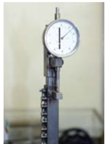
Mit der eigens konstruierten Testeinrichtung messen wir den Verschleiss der Kette über die ganze Länge auf 1/10mm genau.