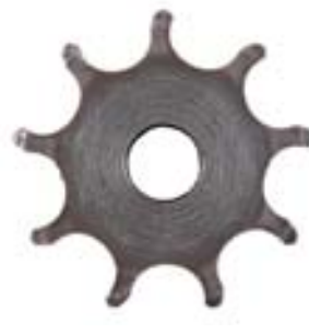
Nachher: Kaum wieder erkennbar! Abgeschliffen durch die gelängten Ketten mit Sand und Wasser.

Test Nr. 3 entspricht einem regnerisch nassen Herbst. Zu Beginn jeder Stunde bei 65 Umdrehungen und 50 Watt Last wechselt die Anzeige auf blau, ein Zeichen, dass Petrus die Wasserpumpe aktiviert hat. Während 15 Min. regnet es ausgiebig. Darauf folgen 15 ereignisfreie Minuten und danach bläst 30 Min. lang ein auf ca. 25°C vorgewärmtes Windchen, die Ketten trocknen teilweise ab. Nach 40 Std. (ca. 1800km) in diesem Rhyth-