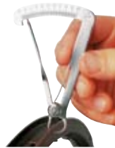
Messen der Felgenflanke