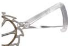
Messen der Bremsscheibe