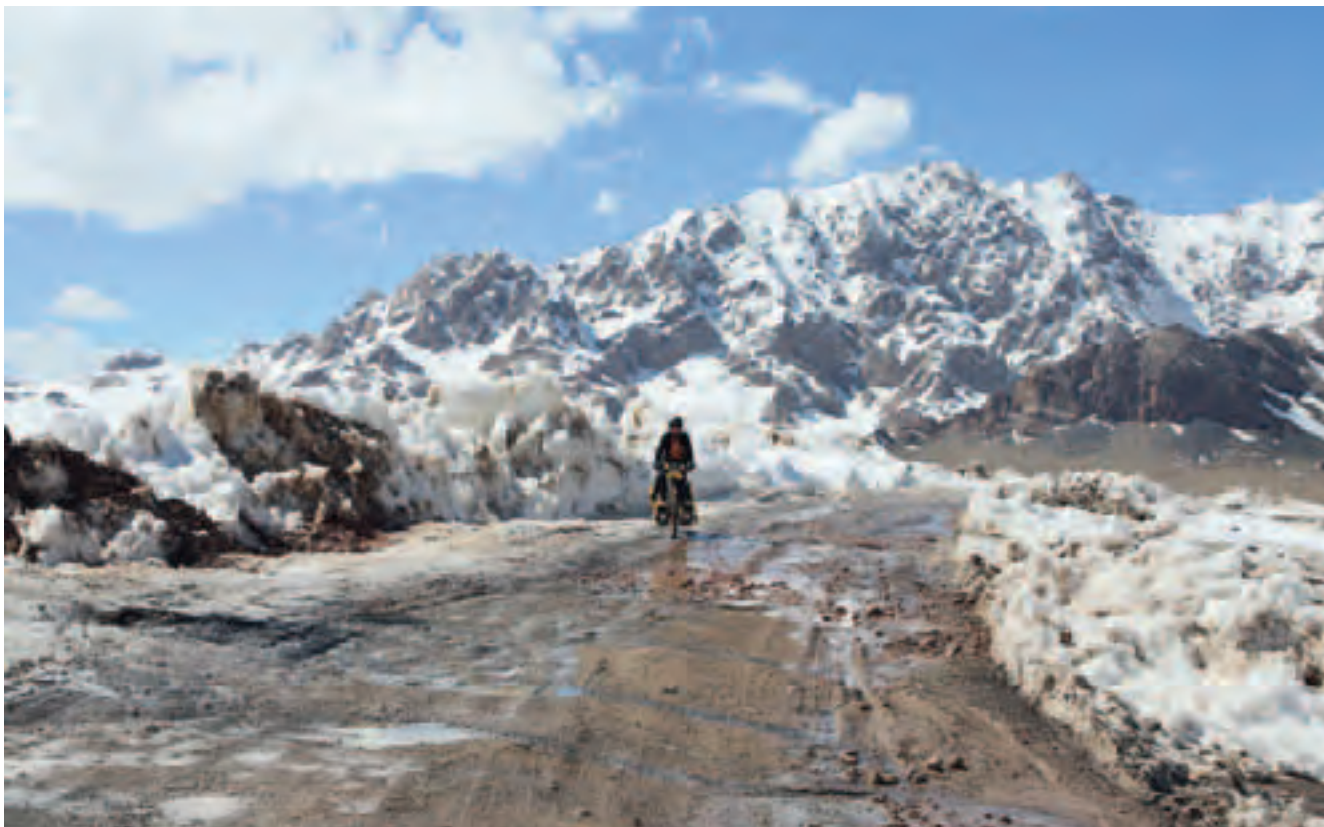
Fast allein zwischen Kirgistan und China. Nur ab und zu steckt ein 40-Tönnner im Dreck.

Wir merken bald, dass auch die Gastfreundschaft andere Züge angenommen hat. Ob Uiguren oder Chinesen, nun wird für etwas, das erst wie eine Einladung scheint, Bezahlung erwartet. Der chinesische Geschäftssinn scheint sich durchgesetzt zu haben. Doch wir werden auch hier überrascht. Nicht selten wird uns in einem besonders staubigen oder heissen Stück aus einem Auto eine eiskalte Flasche Wasser offeriert. Seltener, und damit um so geschätzter erhalten wir Früchte, ein Mittagessen oder gar ein Bett. Generell aber zeigen Chinesen ihre Freude über Besucher auf ihre Art: man wird mit Zigaretten überhäuft, egal ob Raucher oder nicht! Hätten wir sie alle geraucht, es wäre jetzt nicht nur der Weg nach Beijing geteert!