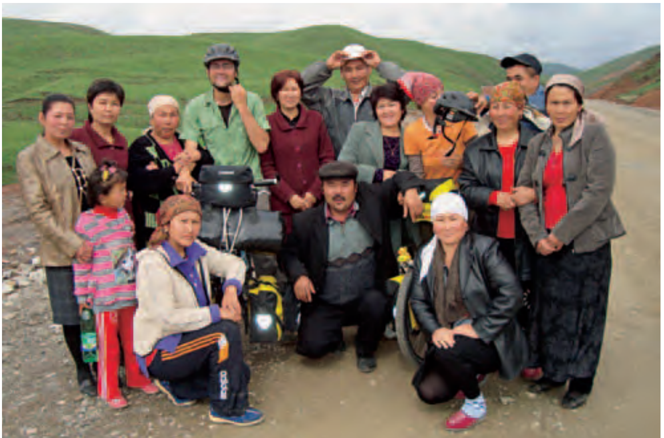
Spontane Fanklubs haben Radreisende in Kirgistan immer wieder

Danach trennen uns nur noch eine Reihe stattlicher Berge von China! Wir biegen auf den Pamir Highway ein, welcher von Osh erst über den Chyrchyk Pass