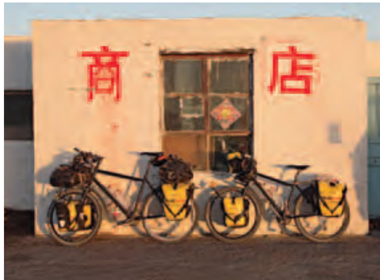
Chinesisches Roadhouse im Abendlicht der Taklamakan

Bald kommen die ersten Trauergäste und erweisen der Familie und der Verstorbenen die Ehre beim gemeinsamen Gebet. Anschliessend wird ihnen Essen angeboten. So kommt im Laufe des Tages das ganze Dorf vorbei. Die Feier verläuft in einer zufriedenen Gelas-