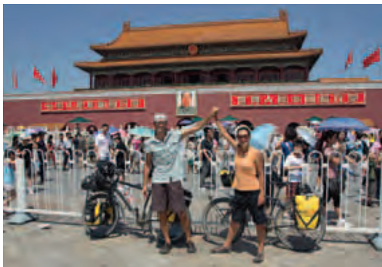
Am Ziel: Auf dem Platz des Himmlischen Friedens